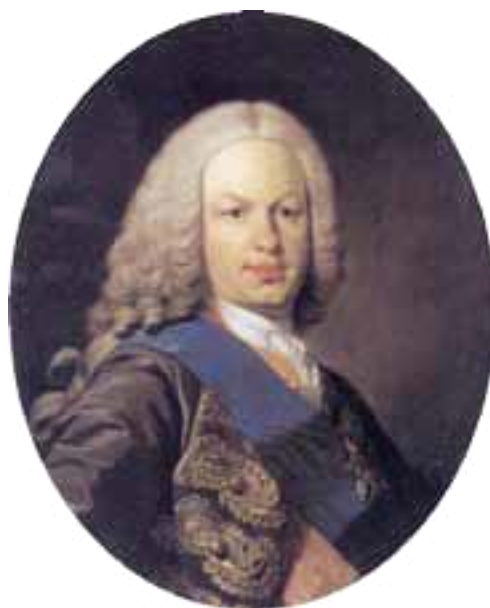
Fernando VI de Borbón quien emitió la Real Instrucción de 1754.

Por otra parte, la propuesta de reforma de la propiedad enfrentaba los intereses de la Metrópoli con los de las oligarquías esclavistas y/o terratenientes, en cuyas manos se encontraba el poder económico y social de las colonias. La tierra constituía el recurso más importante de poder social, así como para la producción de riquezas, y que, por tanto, la reorganización de su propiedad atentaba contra los “intereses creados” en casi dos siglos, tiempo durante el cual se habían consolidado los poderes criollos locales y, a través suyo, la dominación colonial española en el continente. Máxime cuando tales derechos a la tierra de los grandes propietarios, peninsulares y criollos, amparados por los cabildos coloniales, se debían a la “tolerancia” de las autoridades metropolitanas, que vieron producirse las usurpaciones privadas, hechas a costa de las “tierras realengas” que debían custodiar.