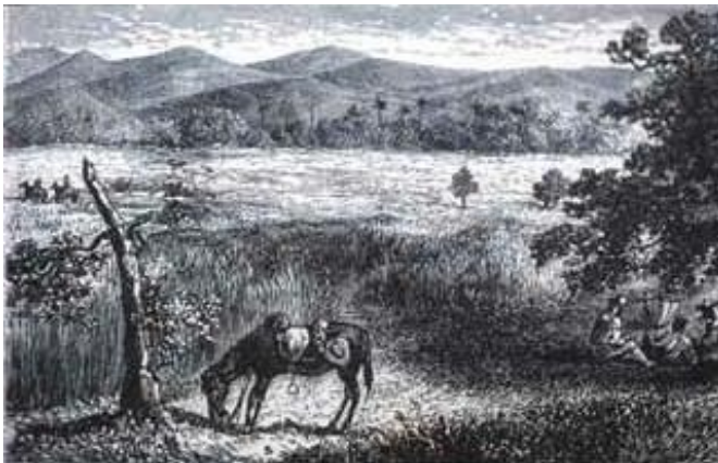
Hato. Dibujo de Samuel Hazard

¿Cuál fue el papel de los modelos de explotación colonial de la isla La Española del siglo XVI, en el desarrollo del capitalismo europeo?