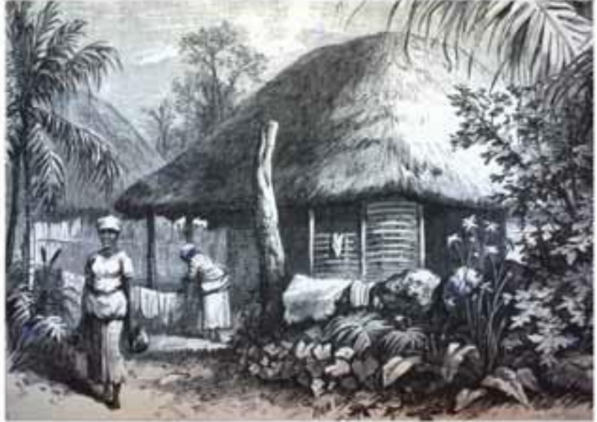
Bohío campesino. Ilustración de Samuel Hazard.

Durante el siglo XVIII también se hicieron visibles cambios sociales que se incubaron lentamente. En efecto, las posibilidades de crecimiento para la población libre de origen africano se ampliaron a partir de las devastaciones. Por otra parte, las posibilidades de obtener la libertad se incrementaron para la población esclava, sobre todo a través de la manumisión por ahorro o coartación, a lo que también parecen haber contribuido los tribunales y las cofradías o hermandades religiosas que permitieron la organización de las personas de origen africano, libres y esclavos.