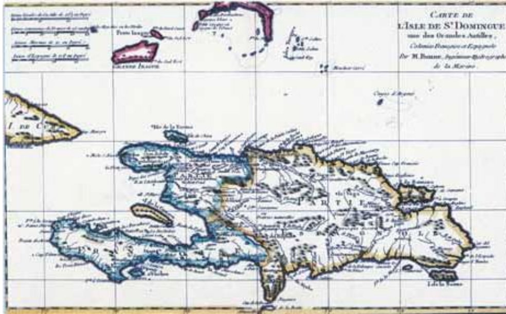
Mapa de la isla de Santo Domingo del siglo XVIII.