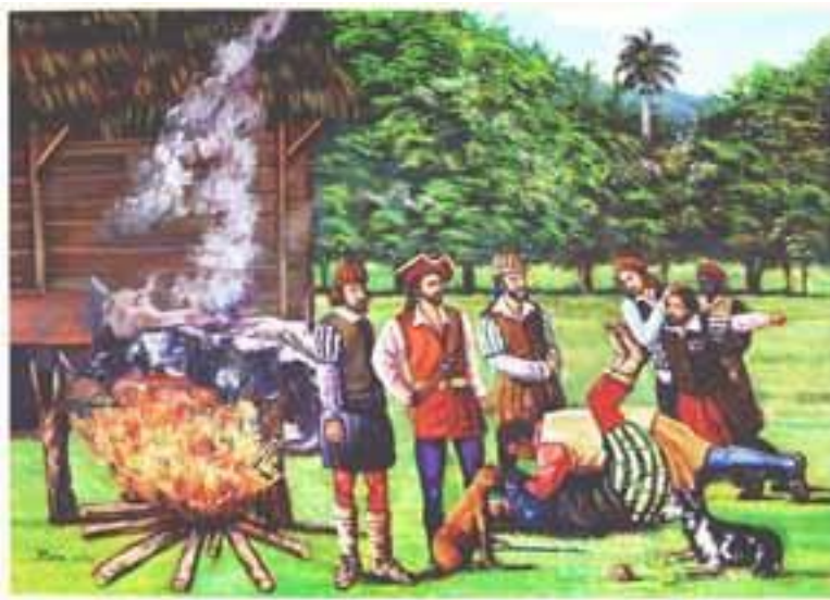
Bucaneros, pintura de Alberto Bass. Colección AGN.

Los primeros ocupantes de la parte occidental de la isla de Santo Domingo fueron los que cruzaban a la isla atraídos por la inmensa cantidad de ganado alzado o cimarrón que se hallaba en los sitios despoblados. Poco a poco estos adoptaron el modo de vida de los monteros, pobladores dispersos trashumantes que vivían de la caza de estos animales, hasta