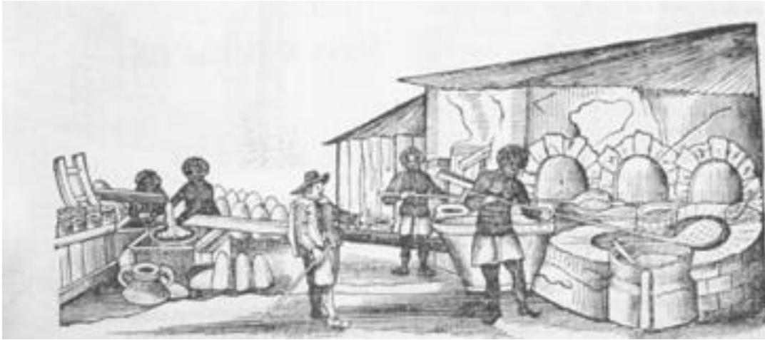
Esclavos en el proceso de elaboración de azúcar.

Salvo en cortos períodos en que el comercio entre ambas colonias fue legal, la mayor parte del tiempo se realizó de contrabando. Esto era posible por la complicidad de las autoridades coloniales españolas, quienes también se beneficiaban del mismo. La práctica del contrabando, como medio de vida, formaba parte de la cultura criolla, en cuya dinámica se habían incorporado los pobladores canarios que fueron asentándose en las villas que se fundaron o las que se repoblaron en el siglo XVIII, particularmente, en los alrededores de lo que se llamaba el despoblado en torno a la frontera norte. De esta manera, el comercio de contrabando era visto como un derecho consuetudinario (es decir, que está basado en la costumbre o tradición), y les permitía desarrollar su actividad económica y ganarse el sustento, para el desarrollo de su vida material y espiritual.