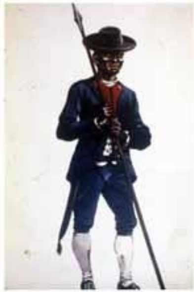
Dibujo de un soldado miembro del Batallón de Pardos y Morenos. Colección Roberto Cassá.

Los constantes enfrentamientos entre las colonias española y francesa durante los siglos XVII y XVIII fueron otro factor de cohesión de la sociedad colonial que actuó junto a la cultura criolla. Desde finales del siglo XVII se organizaron milicias de pardos, dando así cabida en las tareas de defensa del territorio a personas liberas y esclavizadas, no importando si eran clasificados como negros o mulatos. Al mismo tiempo, la estabilización de la colonia francesa de Saint Domingue proporcionó una nueva vía para el comercio de contrabando, debido al impulso que recibió el nuevo establecimiento debido al desarrollo de una colonia esclavista de plantación sin precedentes en la isla.