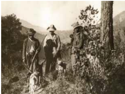
Todavía en el siglo XX existían monteros como lo demuestra esta fotografía.

Hay que añadir otras actividades como las canteras, donde se extrajeron las piedras para construir las edificaciones principales de las ciudades; también la montería, pues ella proporcionaba, entre otros productos, las maderas para la construcción, así como la leña para las fundiciones y las calderas de los ingenios. Todas estas empresas demandaron esclavos indígenas y africanos. Aún más: actividades de los grupos subalternos como eran los “conucos”, en los que se continuó la producción de víveres y tabaco para autoconsumo, así como también la montería que se desarrolló en torno a los hatos a expensas del numeroso ganado cimarrón y del incremento de la población liberta.