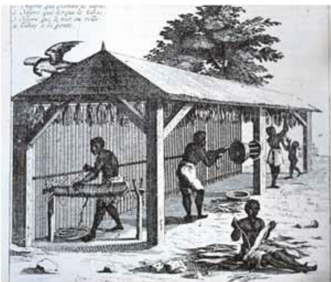
Personas esclavizadas trabajando, liando tabaco.

Desde 1771, se había iniciado la exportación de tabacos dominicanos hacia España para sustituir