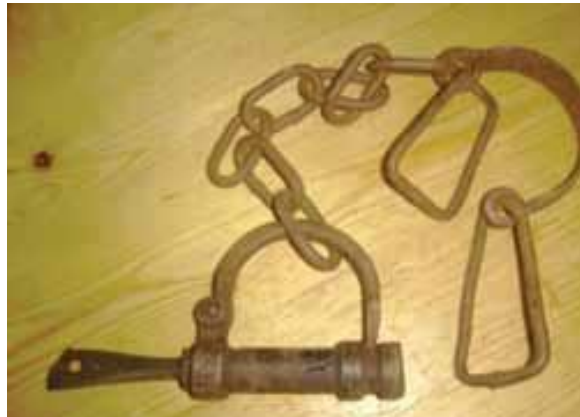
Grilletes utilizados para apresar a las personas esclavizadas.

En este punto convergieron los intereses de la Corona con los intereses privados de los propietarios esclavistas del Santo Domingo español. Pero sólo por un tiempo. Esa coincidencia de los intereses locales y metropolitanos en la reforma de la población de origen africano, esclava o libre, para hacerla una población “útil” a los fines del fomento que buscaban las demás reformas. Es otro antecedente en el conjunto de factores que llevó a la formación de un “Proyecto de Código Negro Carolino”, cuya elaboración fue encargada a uno de los ministros de la Audiencia de Santo Domingo en 1783.