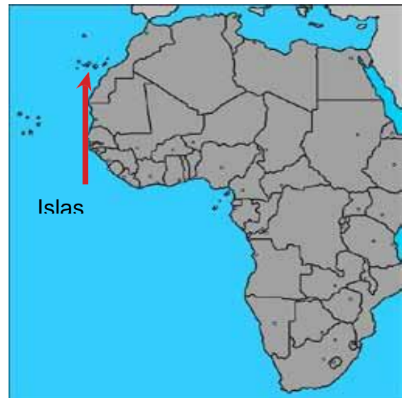
Mapa mostrando islas Canarias.

La recuperación del siglo XVIII, como ha sido llamado el período central de este siglo, hace referencia a dos resultados básicos: uno, la inversión de la tendencia decreciente de la población y, dos, al restablecimiento de cierto nivel de comercio legal y regular con el exterior. Un factor clave en la preparación de dichos resultados está dado por las políticas borbónicas de repoblación y reformas. Las primeras retomaban medidas que se habían iniciado durante el reinado de Carlos II al re-fundar y crear poblaciones con familias traídas de las Canarias; pero la política de reformas debió esperar a la segunda mitad de la centuria. En ese siglo se produjeron dos corrientes migratorias importantes: la de los canarios y la de las personas esclavizadas fugadas de Saint Domingue o introducidos por las costas o por el mismo puerto; eso permitió una expansión en el territorio controlado por las autoridades españolas en la isla.