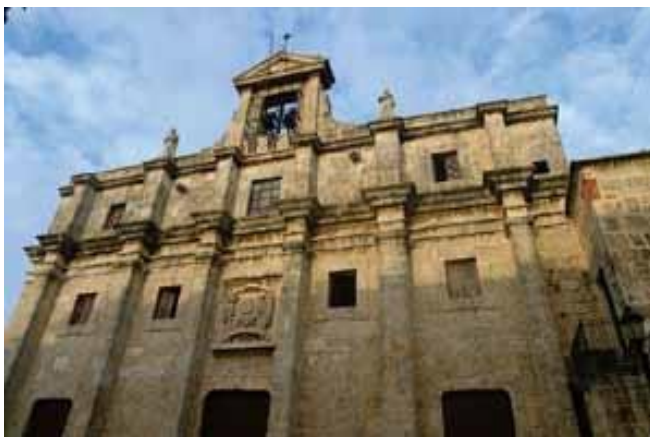
Iglesia de los Jesuitas hoy Panteón Nacional. Única construcción en del siglo XVII en la ciudad de Santo Domingo.

A partir de las despoblaciones de 1605 y 1606 las dificultades económicas de la colonia empeoraron. Los ingresos por impuestos como los almojarifazgos, las alcabalas, y los diezmos, entre otros, resultaron insuficientes para sostener el personal burocrático y militar destacado en ella. Para resolver el problema se situaron los gastos de las cajas reales de Santo Domingo en las cajas de Panamá y luego de México; en estas últimas permanecieron hasta el final de la época colonial. En 1608 llegó el primer “situado” como se le llamó popularmente al dinero que se recibía desde México para el pago de las tropas y la burocracia, incluidos los eclesiásticos.