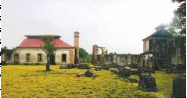
Ruinas del ingenio de Boca de Nigua.

Entre los cambios atribuidos a las reformas está la reactivación de algunas plantaciones en el antiguo partido de los ingenios, lugar tradicional de las haciendas de azúcar, donde había florecido esta actividad en el siglo XVI, de la que todavía quedaban vestigios y algunos pequeños ingenios y trapiches. Dos siglos después eran las instalaciones