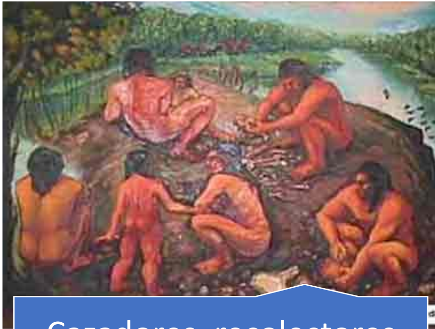
Cazadores, recolectores pescadores= pre-agrícolas