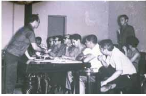
Reunión del Movimiento 14 de Junio, 1962. Colección Roberto Cassá.

La oposición del Movimiento Revolucionario 14 de Junio (1J4), y del Partido Revolucionario Dominicano (PRD), en contra del Consejo de Estado, junto a los acontecimientos del 16 de enero, generaron la continuación de los enfrentamientos violentos que devinieron en un auto golpe de Estado que llevó al poder a una Junta Cívico Militar encabezada por Huberto Bogaert. La reacción contra el auto-golpe se produjo el 18 de enero de 1962 cuando un grupo de oficiales apresó a Rafael Rodríguez Echevarría. Una