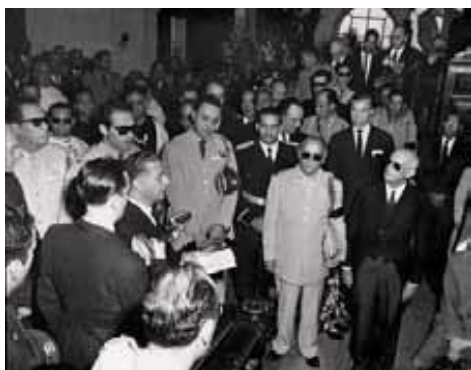
Joaquín Balaguer leyendo el panegírico de Rafael L. Trujillo.

Desparecido físicamente el tirano Trujillo, se configuró un escenario político caracterizado por el activismo de diversas fuerzas políticas procurando asumir el control del proceso de transición o apertura democrática en la República Dominicana. El propósito común de estas diversas fuerzas, las hizo actuar de manera conjunta contra los remanentes del trujillismo en principio, pero su carácter heterogéneo y policlasista generó divergencias y fisuras en el movimiento social que emergió de la necesidad de destrujillización de la sociedad dominicana en 1961.