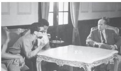
Héctor García Godoy (1921 - 1970).

Los esfuerzos para buscar una salida negociada al conflicto se intensificaron a partir del mes de junio, y se inició un largo e intenso proceso de negociación entre una misión de la OEA, encabezada por el embajador estadounidense Ellsworth Bunker y el Gobierno Constitucionalista. La propuesta fundamental consistía en la designación de un gobierno provisional, cuya misión sería crear las condiciones favorables para preparar las elecciones de junio de 1966.