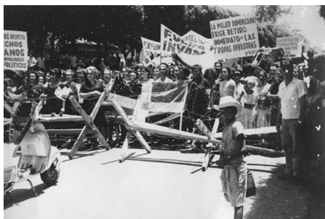
Mujeres manifestándose en contra de la segunda ocupación militar estadounidense en 1965.

Una recomposición del cuadro político y militar fue impuesta en lo inmediato por la fuerza de ocupación. Se dividió la ciudad de Santo Domingo en dos partes, con la excusa de un cordón de seguridad. El objetivo era de confinar y aislar a los rebeldes constitucionalistas en Ciudad Nueva y la Zona Colonial en un reducido espacio de 14 cuadras. De esta manera se trataba de evitar la extensión o generalización de las acciones militares a otros espacios del territorio nacional.